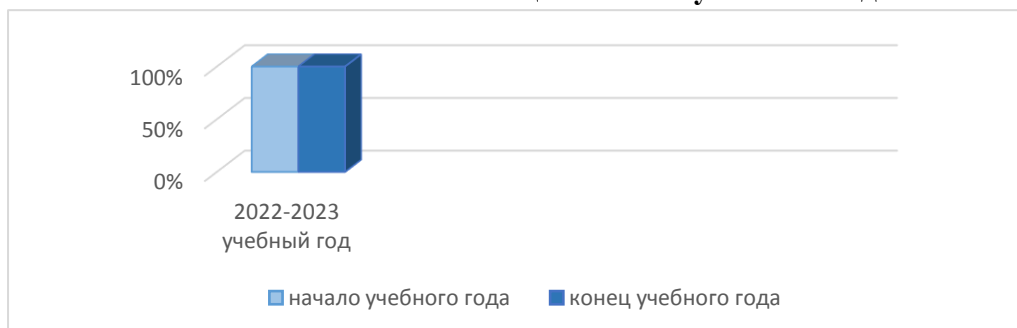
Диаграмма динамики численности обучающихся на начало и конец 2022-2023 учебного года.